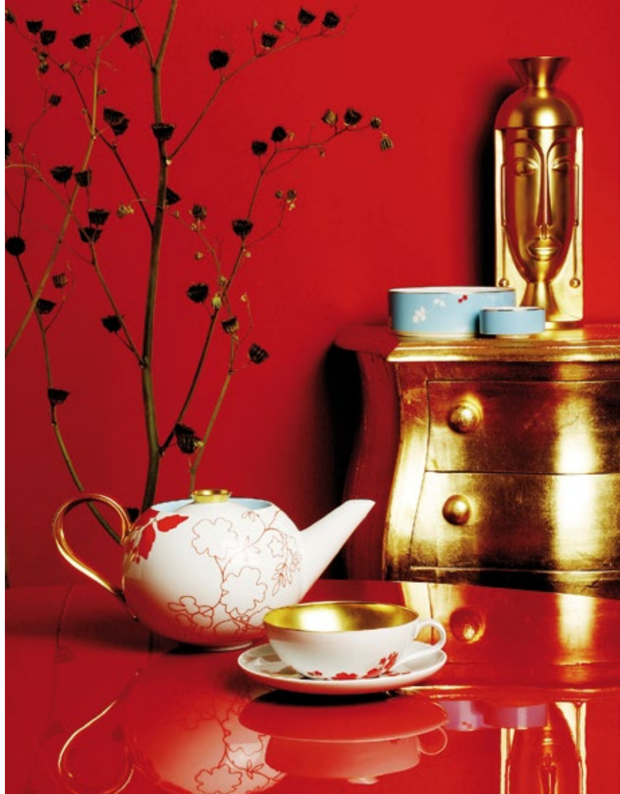
Snídaňová souprava My China!, kolekce Císařova zahrada, Fürstenberg.