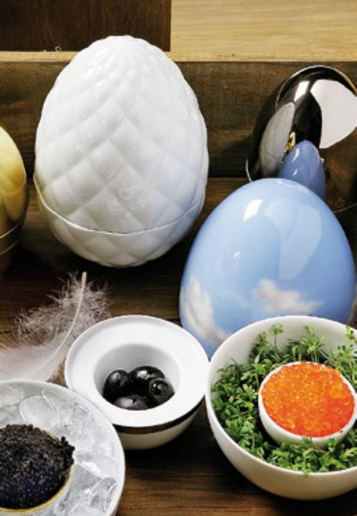
Speciální velikonoční kolekce kalíšků na vejce Matroschka, Fürstenberg.