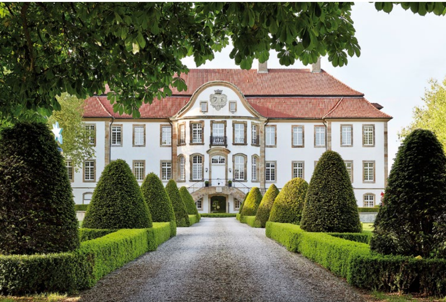
Rekonstruovaný zámek Harkotten, v němž sídlí Sieger design.

stavám architekta a nabízelo potenciál. Vyhovovalo jeho životnímu stylu, zároveň ale vyjadřovalo sílu a solidnost firmy. Původní pokoje se během rekonstrukce proměnily ve společenské místnosti, hi-tech kanceláře, pracovny i technické zázemí firmy.