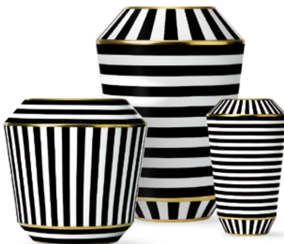
Váza Luna, Fürstenberg, z jemného porcelánu, ručně zdobená 24 karátovým zlatem.

Architekt, lodař a designér Dieter Sieger (1938, Münster) položil roku 1964 základy rodinné firmy, již dnes známe pod názvem Sieger design. V 80. letech minulého století způsobily jeho návrhy koupelnového vybavení u značek Dornbracht, Alape a Duravit doslova revoluci a hodně jím v té době navržených produktů se vyrábí dodnes, například ikonická baterie Tara (1992). V roce 1988 Dieter pronajal a rekonstruo-