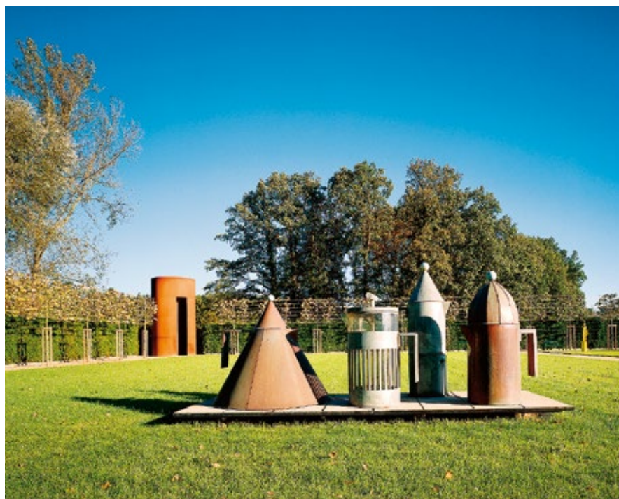
V parku jsou rozmístěny solitérní objekty, zde kávový set, Aldo Rossi.