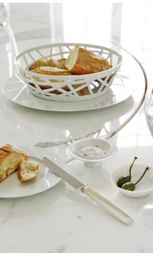
Porcelánová mísa na pečivo a na ovoce z kolekce My China!